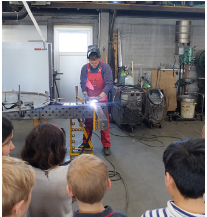
In een inoxbedrijf leren kinderen de technieken van vroeger en nu.

Meestal zit het in veel kleine dingen, maar een duidelijk voorbeeld was de stopzetting van jeugdverblijfcentrum De Sceure in Vleteren eind 2018. Toen werd direct aan ons gedacht. Zo werd ons via enkele tussenpersonen gevraagd om de samenwerking met Plattelandsklassen vzw over te nemen. Dat is natuurlijk een fantastisch mooi aanbod voor een startend jeugdverblijf.