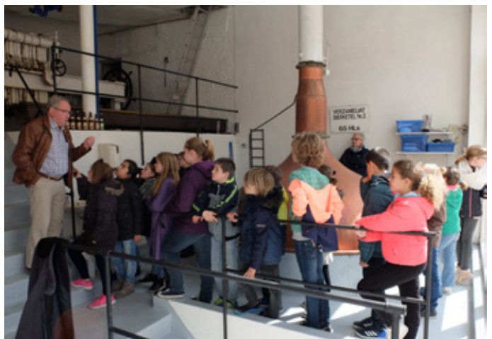
Op zoek naar de brouwgeheimen van bier en limonade.