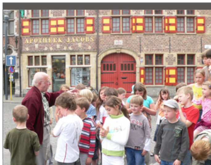
Op stadsverkenning met een gids.

Tot slot is de omgeving rondom het jeugdverblijf een dynamisch gegeven. Er zijn voortdurend nieuwe ontwikkelingen en wat vandaag is, kan morgen niet meer zijn. Daarom is het een blijvend aandachtspunt om regelmatig te actualiseren wat je groepen aanbiedt.