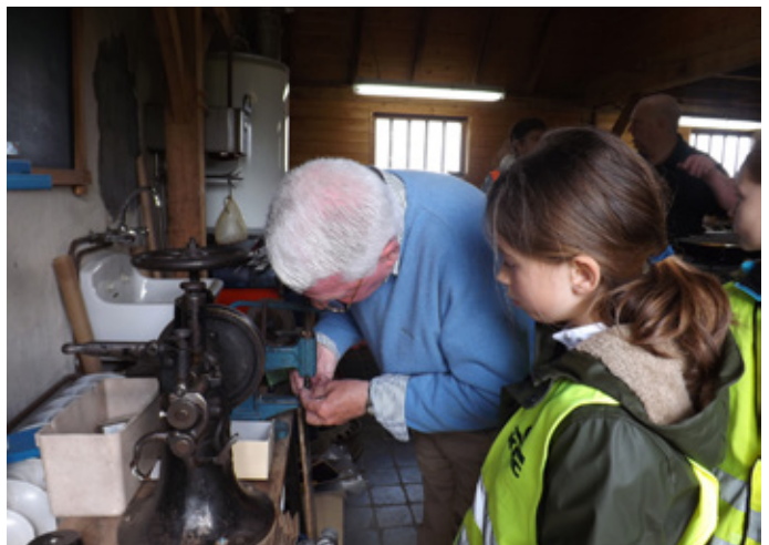
Een bezoek aan een ambachtelijk leeratelier.