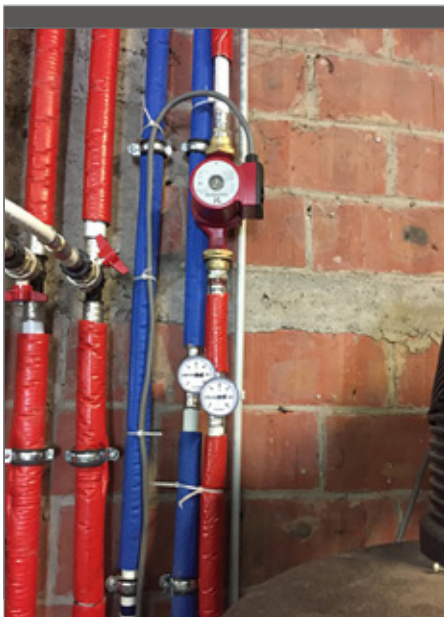
Onze leidingen zijn goed geïsoleerd.

Er zijn niet onmiddellijk gevolgen omdat de gevarezone voor legionella hoger ligt dan 2 000 KVE. Het waterstaal werd daarom ook goedgekeurd, maar we ondernemen uit voorzorg toch nog bijkomende stappen. We leggen nog een bijkomende leiding zodat leidingwater en putwater niet door dezelfde leiding moeten en leggen op het koudwaternetwerk nog een extra retour