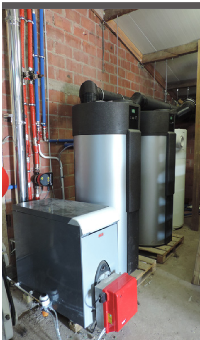
Nieuwe warmwatertoestellen moeten geplaatst zijn conform de best beschikbare technieken.

Het klopt dat legionella en duurzaamheid moeilijk te rijmen zijn, maar de pompen afzetten kan niet, behalve als het jeugdverblijf enkele weken of maanden sluit.