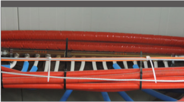
We spoelen frequent de leidingen.

kens opnieuw drukken, een probleem dat wel opduikt bij douches met een optisch oog.