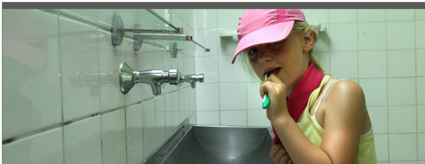
Met legionella besmet leidingwater dat gewoon uit de kraan loopt, levert geen gevaar op.

van de uitvoerder en eindverantwoordelijke. De standaardbeheersmaatregel is temperatuurbeheersing.