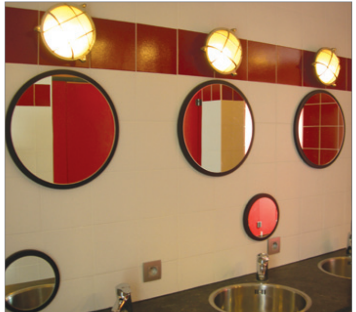
Goede armaturen vermijden hinderlijke weerkaatsing of verblinding.

Het materiaal waaruit de lichtarmatuur is vervaardigd, speelt hierbij een belangrijke rol. Kies een armatuur die zo weinig mogelijk licht absorbeert. Materiaal met een hoge en weinig diffuse reflec-