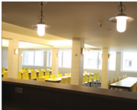
Een lichtstudie helpt efficiënt verlichten.