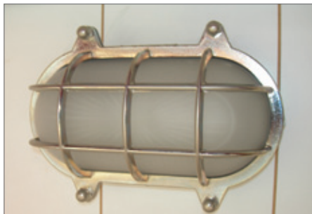
Ons denkwerk resulteerde in lichtarmaturen uit de zeevaart.

In de winter staat de zon laag waardoor het zonlicht rechtstreeks op het glas schijnt en licht binnen brengt. In de zomer staat de zon hoger en schermen de luifels de zon op het glas af. Omdat het glas niet wordt bedekt, kan daglicht optimaal binnen.