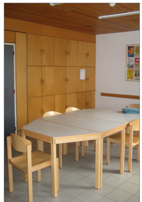
Tafels in verschillende vormen maken meerdere schikkingen mogelijk.

Het bovenste bed van een stapelbed is voorzien van bedrandbeveiliging.