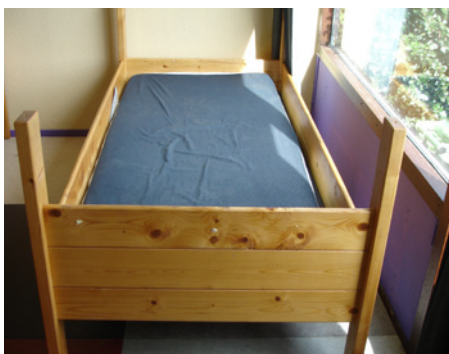
De gebruikte zijpanelen zijn hoog genoeg, zodat extra bedrandbeveiliging niet nodig is.