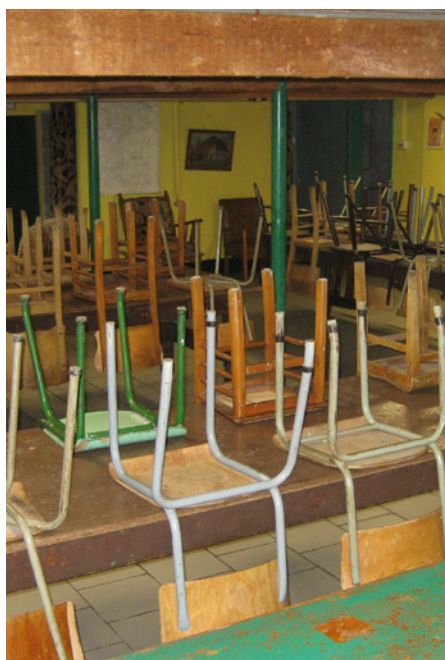
Kies je favoriete stoel uit.

Dezelfde voorwaarden voor type A en B gelden voor type C. Voor elk bed is nog een beschermhoes, een hoofdkussen en een deken voorzien.