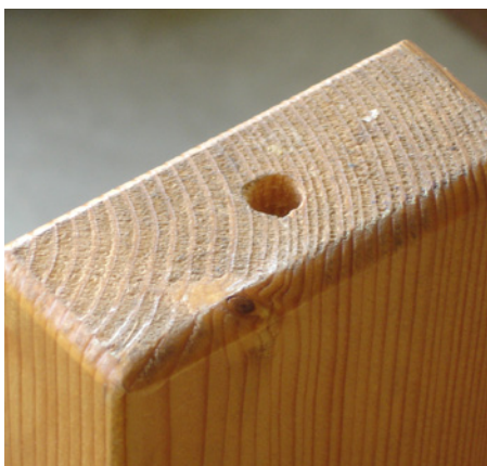
In de poten van de bedden wordt een gat voorzien voor een ijzeren staaf.

Lieven Van den Heuvel baat samen met Nicole Elst reeds 12 jaar de Caernhoeve uit. Het domein in Essen telt drie afzonderlijke entiteiten. Twee jeugdverblijven zijn van het type A en hebben een binnencapaciteit van respectievelijk 60 en 30 personen. Het derde en kleinste jeugdverblijf, met een maximale binnencapaciteit van 16 personen, is een type B. Enkele meubels voor het jeugdverblijf werden in de schrijnwerkerij van Lieven gemaakt.