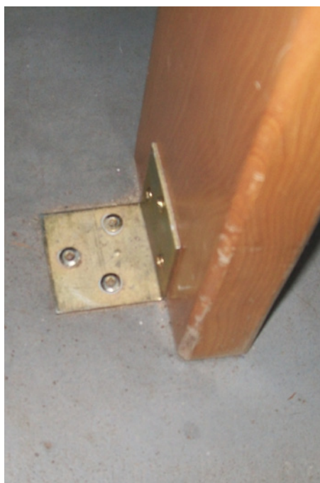
Verankerd meubilair kan niet verplaatst worden, waardoor de kans op schade verkleint.

Tafels en stoelen worden sowieso verplaatst. Daarom wordt best over het gewicht gewaakt. Zware tafels en stoelen zijn onhandelbaar en worden sneller versleekt met als gevolg dat poten plooiën of gewoon afbreken. Bovendien verhoogt het verplaatsen de kans op schade aan het gebouw, bijvoorbeeld aan de deurstijlen of bij bepaalde types van vloerbekleding.