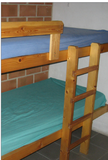
Het bevestigen van een bed aan de muur komt de stevigheid ten goede.

Soms is het ook belangrijk rekening te houden met de structuur van de refter, alvorens tafels en stoelen te kopen. Hoe worden de tafels en stoelen best geschikt en welke afmetingen moeten die hebben om een maximale bezetting en een goed zitcomfort voor de groepen te hebben? Hou er ook rekening mee dat stoelen en tafels bij elkaar moeten passen. Stoelen die op een tafelpoot stoten of te laag zit-