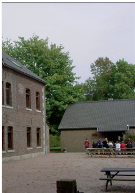
Bij een optie is het belangrijk een vervaldatum te vermelden.

Het opstellen van een plaatsbeschrijving kan enkel tussen twee handelingsbekwame personen. De huurovereenkomst vermeldt daarom best de verplichte aanwezigheid van een meerderjarige bij aanvang van het verblijf.