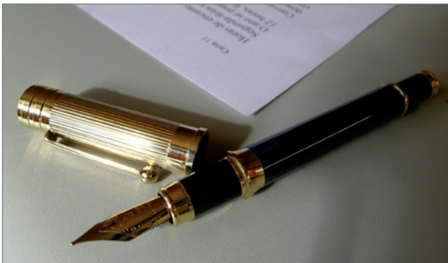
Het is absoluut aan te raden het contract op papier te zetten.

ving (terecht) gevoelig. Wie bijvoorbeeld consequent joodse of allochtone verenigingen uitsluit, zal het niet gemakkelijk hebben in de rechtbank.