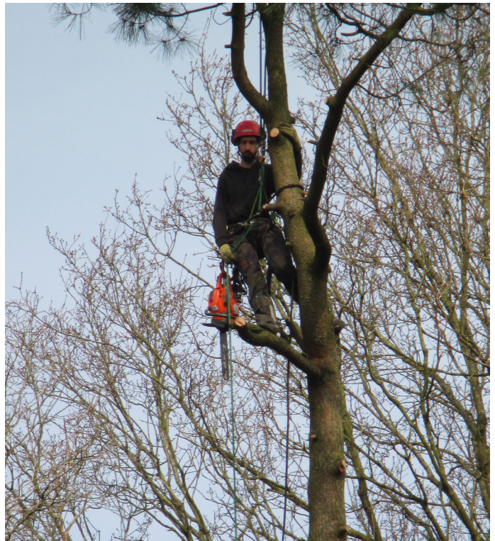
Bepaalde jobs, zoals bosbeheer, besteed je misschien beter uit aan gespecialiseerde firma's

In de hiërarchie van preventieve maatregelen staat het vermijden en elimineren van het gevaar en de risico's bovenaan. In een bosrijke omgeving zou je alle bomen kunnen rooien. Dan vermijd je vallende takken en bomen en is bosbeheer niet meer nodig. Maar dat is natuurlijk niet de bedoeling. Wel kan je bepaalde risico's overdragen. Bij bosbeheer kan je de gevaren die inherent zijn aan de job voor personeel en vrijwilligers, elimineren door dit uit te besteden aan een gespecialiseerde firma. Opgelet echter: bij het uitbesteden blijf je als uitbater verantwoordelijk voor het correct uitvoeren van de taken, dit voor zover je dit kan inschatten. Als uitbater moet je dus ingrijpen als bijvoorbeeld gewerkt wordt zonder individueel beschermingsmateriaal.