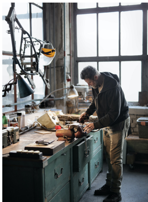
De wetgeving inzake welzijn op het werk is de basiswet op vlak van veiligheid en gezondheid op het werk.

Waarop de methodieken geen antwoord bieden, is de vraag welke risico's je eerst moet aanpakken. Wil je weten wat de grootste risico's zijn, kan je rangschikkingsmethoden gebruiken. Alle beschikbare methoden opsommen zou ons te ver leiden, daarvoor verwijzen we naar de FOD Werkgelegenheid, arbeid en sociaal overleg die een brochure 'risicoanalyse' aanbiedt waarin alle methodieken vermeld staan.