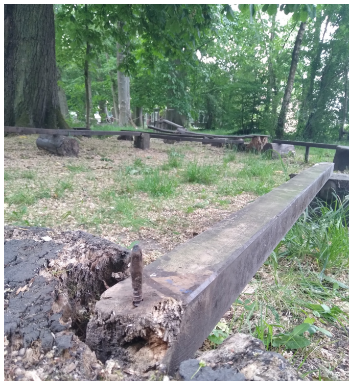
Door slijtage kan het risico verhogen.

Aan de hand van een concreet voorbeeld, nl. de potentiële gevaren van een bosrijke omgeving, lichten we vijf risicofactoren toe. Want zowel bosbeheer als spelen in een bos zijn niet altijd zonder risico.