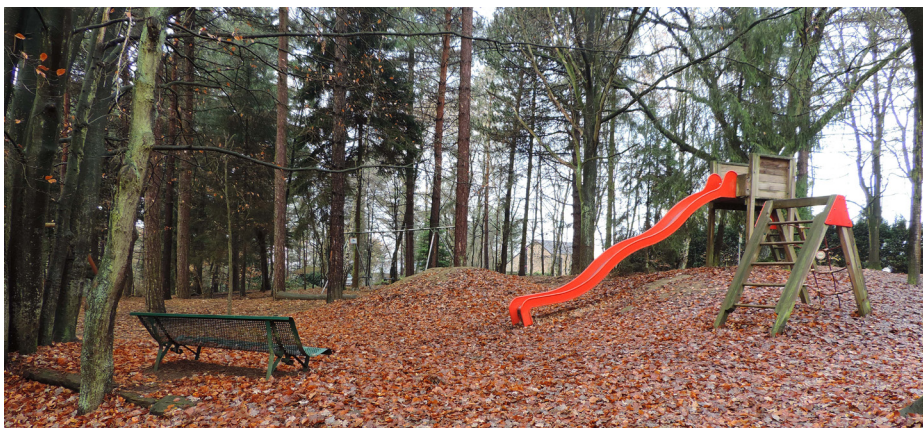
Het kb op de speeltoestellen verplicht een risicoanalyse.