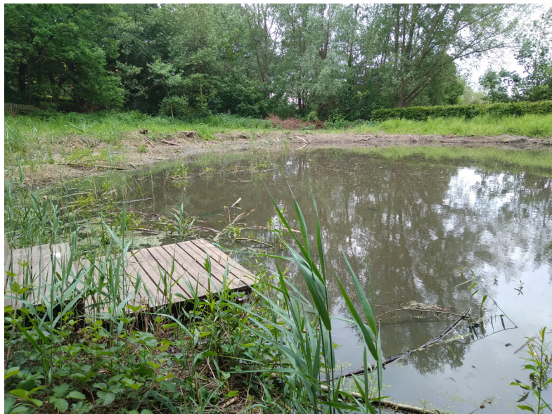
Bij een vijver schuilen meerdere risico's.

Een risicoanalyse is een dynamisch proces. Bestaande risicoanalyses worden constant geëvalueerd en indien nodig bijgesteld. Bovendien wordt bij elk nieuw product, elke nieuwe stof of elke nieuwe situatie een nieuwe risicoanalyse opgemaakt. Daarom zijn risicoanalyses nooit helemaal klaar.