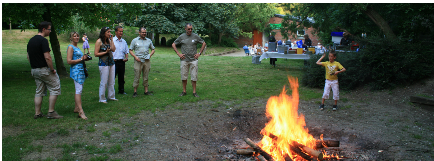
Je handelt als een voorzichtig en redelijk persoon als je je bewust bent van de risico's en daarmee op een structurele manier aan de slag gaat.