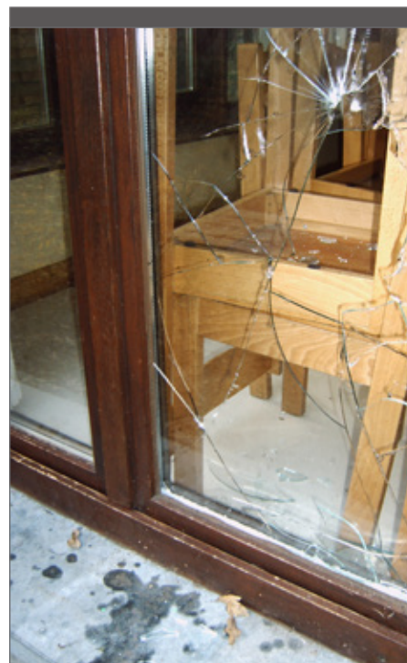
Verenigingen hebben meestal een goede BA-verzekering.

Maak de rekening van het wangedrag op het einde van het verblijf. Sommige groepen verrichten namelijk in de laatste uren van hun verblijf nog wonderen. Overweeg eventueel zelfs een tweede kans. Groepen kunnen dan, indien nodig en mogelijk, nog wat bij poetsen of zelf enkele herstellingen uitvoeren.