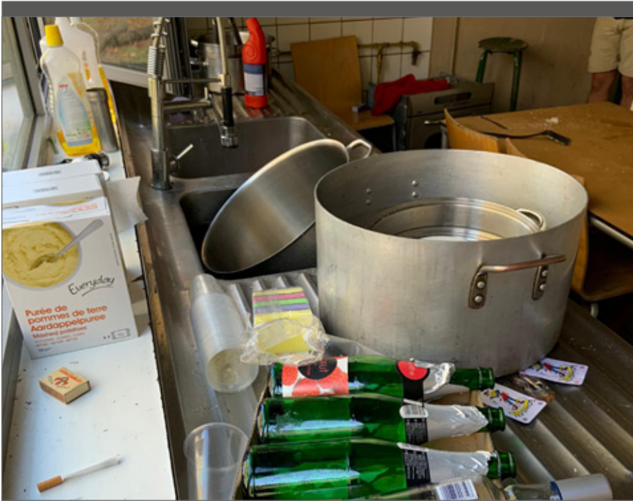
Sommige groepen verrichten in de laatste uren van hun verblijf nog wonderen.

Als de huurprijs volledig op voorhand is betaald, kan de waarborg een belangrijke stok achter de deur zijn bij wangedrag. De grootte van de waarborg kan je zelf bepalen, maar het bedrag moet wel redelijk zijn. Het bedrag van de waarborg dekt best bij benadering de bijdrage voor energie en het franchisebedrag van de aansprakelijkheidsverzekering (zie kader). Als blijkt dat de waarborg nauwelijks voldoende is om de energiekosten te dekken, kan je eigenlijk niet spreken over een echte waarborg.