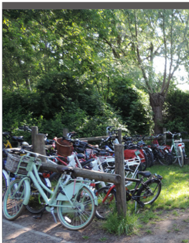
Een veilige en voldoende grote stalplaats voor fietsen is een troef.

Komen groepen met de fiets of wil je dat promoten, dan moeten die fietsen meestal wel gedurende het volledige verblijf gestald worden. Een veilige en voldoende grote stalplaats, eventueel overdekt, is dan zeker een extra troef, zodat de kans op schade of diefstal verkleint.