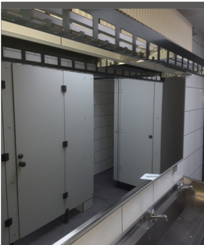
Haakjes en legboorden in het sanitair zijn handig voor het ophangen van handdoeken of het plaatsen van toiletzakken.