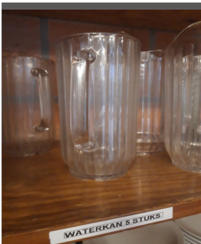
Dankzij labels komt materiaal terug op de juiste plaats.