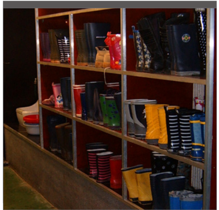
Een schoenenrek nodigt uit om schoenen uit te doen.