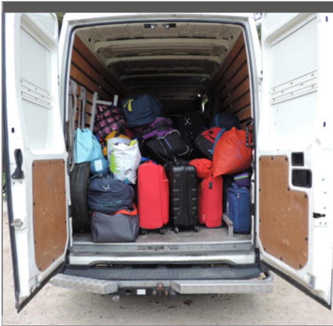
Voorzie bergruimte voor materiaal van groepen.