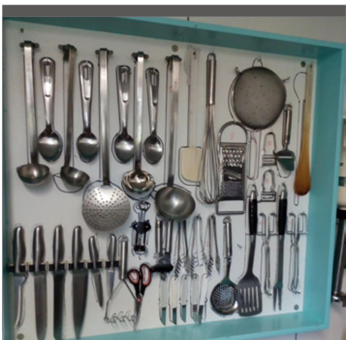
Visualiseer waar kookmateriaal moet hangen.

De keuze tussen rekken en kasten hangt af van de situatie. Kastdeuren beschermen voeding en kookmateriaal tegen stof, maar brengen wel enkele ongemakken met zich mee. Zo kan je niet zien wat achter de kastdeuren zit en moet je de deuren telkens openen en sluiten. Bij rekken heb je die ongemakken niet, maar is voeding en kookmateriaal ook minder beschermd. Als alternatief voor kastdeuren kan je daarom misschien beter kiezen voor een kast met rolluiken. Die kan je voor gebruik openen en pas na gebruik terug sluiten. Wanneer de kasten en/of rekken opgesteld staan in de keuken, moeten ze omwille van de voedselveiligheid minstens afwasbaar zijn. In een afzonderlijke bergruimte is dit eveneens handig, maar geen vereiste.