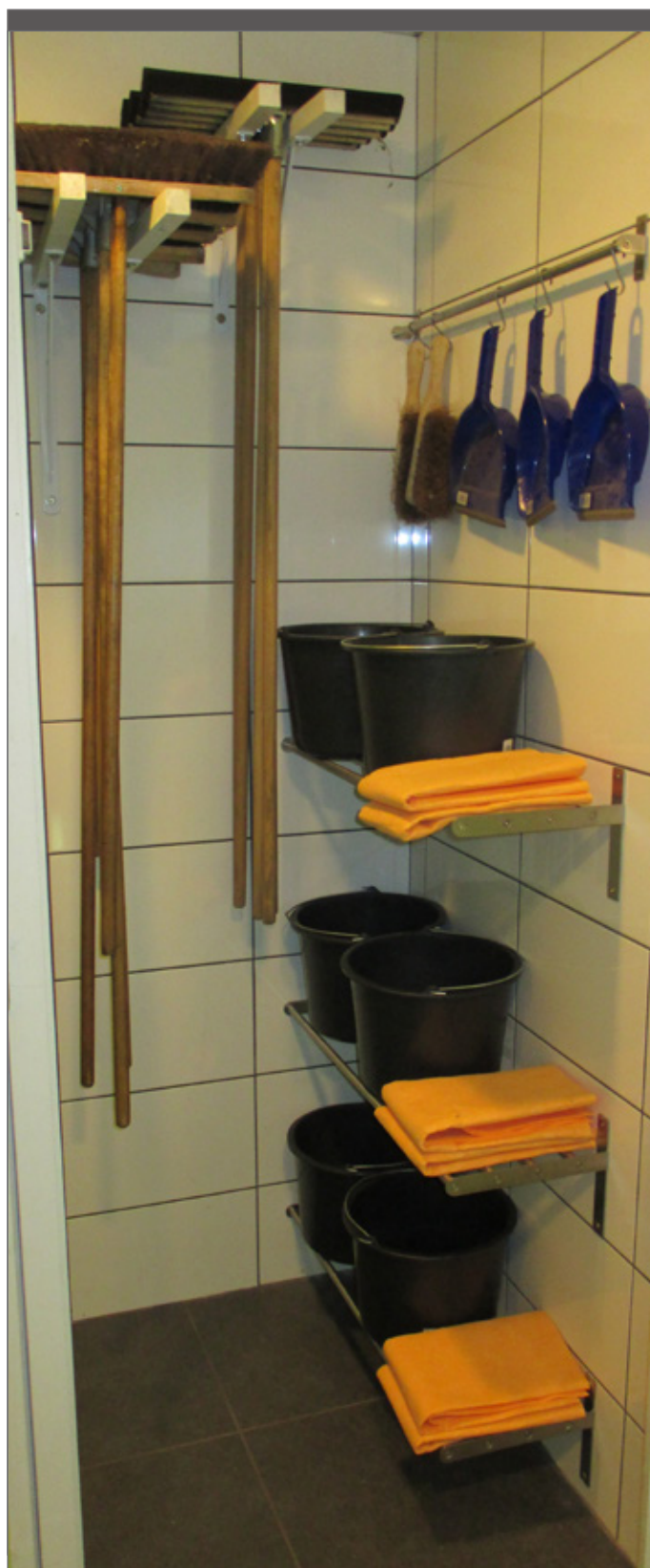
Hoe meer poetsmateriaal aanwezig is, hoe sneller de opkuis kan gebeuren.

Tine: Het nadeel van de vele opbergruimtes is dat je veel producten en materiaal extra moet verplaatsen. Wordt bijvoorbeeld drank geleverd, dan verdwijnt dit eerst in de kelder, alvorens het in de bar terecht komt. Om die tussenstap te schrappen, bouwen we bin-