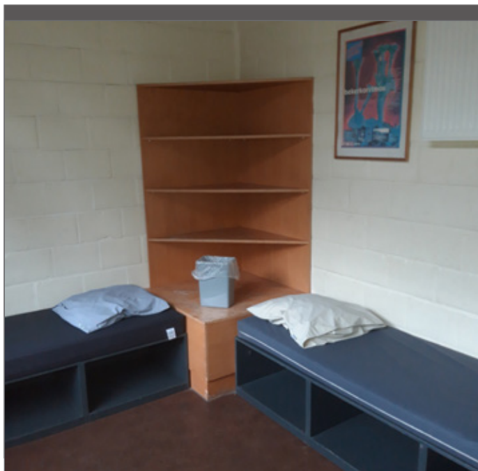
Legboorden zijn praktisch voor het opbergen van brillen, horloges, zaklampen en smartphones.