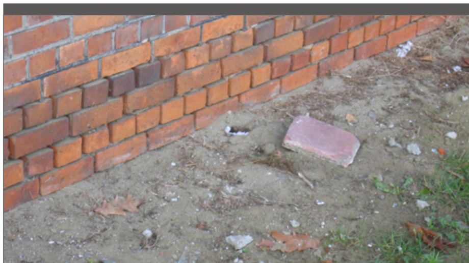
Herstel wat stuk is om verdere verloedering te voorkomen.

timer helpen. Hoewel er niemand in het gebouw aanwezig is, wordt op die manier toch iets anders gesuggereerd.