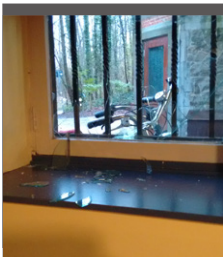
De politie kan vaak weinig doen.