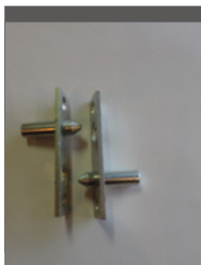
Een dievenklauw vermijdt dat deuren uit het scharnier worden getild.

Je kiest best een meerpuntsvergrendeling waarvan de afstand tussen de verschillende punten minstens 20 centimeter is en de horizontale