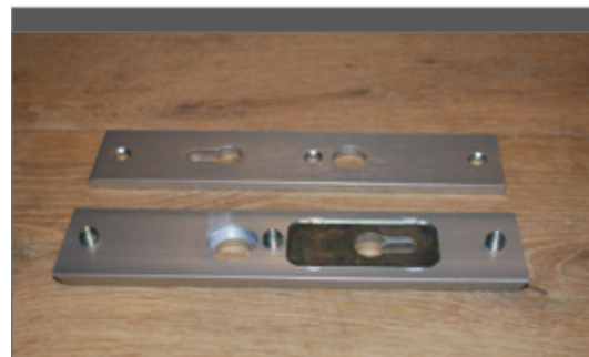
Veiligheidsbeslag met kernbescherming zorgt voor een extra bescherming van de cilinder.

Tom Van Hemel baat niet alleen 't Chaletje (een jeugdverblijf type B in formule zelfkook) in Bocholt uit, hij is ook slotenmaker van beroep. In die hoedanigheid vroegen we hem een aantal tips voor de beveiliging van een jeugdverblijf.