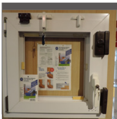
Raamblokken bemoeilijken een inbraak via het raam.

nachtschoten minstens 2 centimeter lang zijn. Een andere optie is het plaatsen van bijzetsloten.