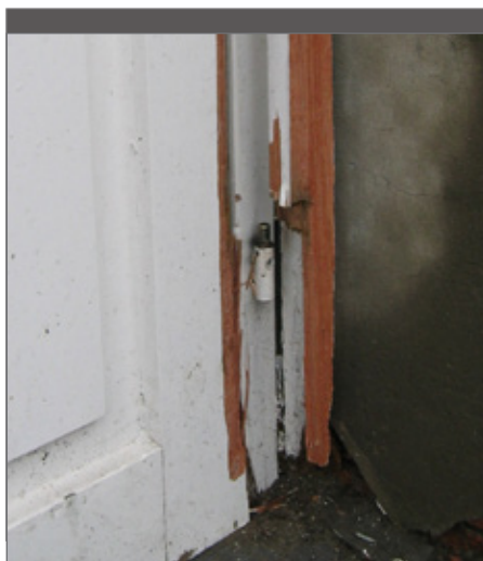
Een deur uit de scharnieren tillen is een beproefde inbrekerstactiek.

Vandalisme komt bij ons gelukkig niet voor en sluikstorten beperkte zich in het verleden enkel tot bewoners of voorbijgangers die hun afval in onze containers