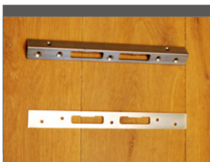
Met een stevige sluitplaat is het slot beter beschermd.