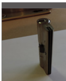
Een veiligheidscilinder is moeilijker te breken of te doorboren.