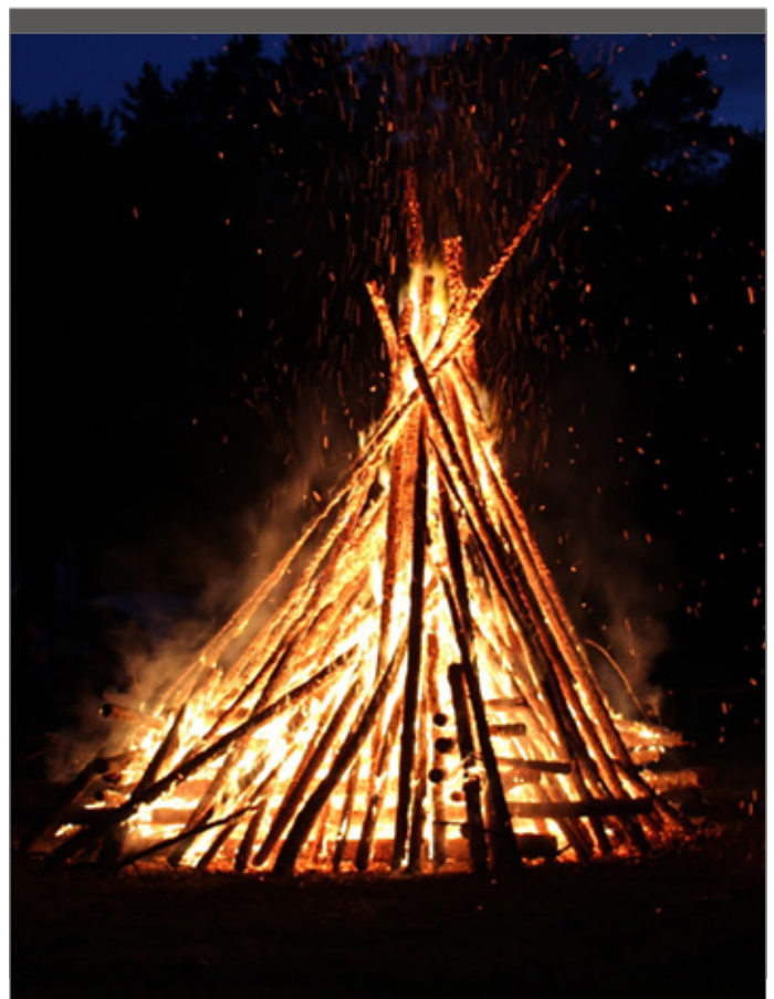
Ook aan een kampvuur kan het er behoorlijk luid aan toe gaan.

Goed om weten is dat ook de koepels van de jeugdbewegingen beseffen dat er iets moet gedaan worden. Geluidsoverlast wordt het centrale thema van de kampencampagne in 2018. Dit wordt de komende maanden uitgewerkt, maar ook vanuit de koepels zullen de plaatselijke groepen dus gesensibiliseerd worden. En dat is goed, want nu geen actie ondernemen zal alleen maar leiden tot meer klachten, meer verbodsbepalingen, meer boetes enz.