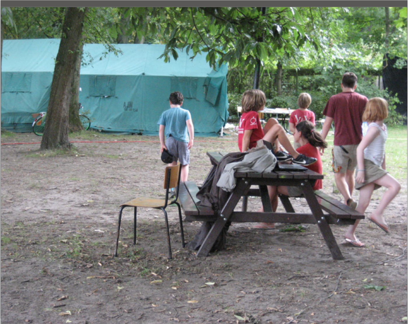
Bijna de helft van de (theoretische) zomercapaciteit is op rekening van tenten.