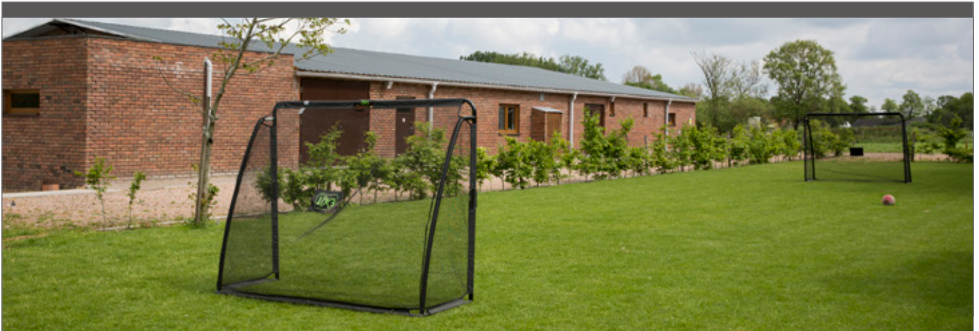
Enkel voor scholen staat een speelweide in de top 10 van zoekcriteria.