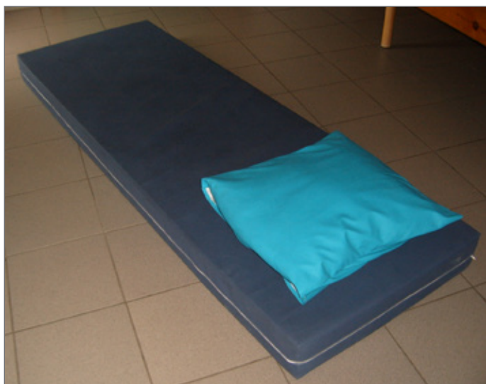
Op 1 februari weten we hoe de geselecteerde matras en beschermhoes er zal uit zien.

TIP: hoewel de hoezen rond het schuim van goede kwaliteit zijn, is door oneigenlijk gebruik schade niet uit te sluiten. Daarom is het aangewezen enkele extra hoezen te bestellen. Zo geniet je extra van de lagere prijs van de samenaankoop en de subsidie door Toerisme Vlaanderen.