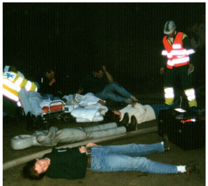
Opschaling gebeurt als de situatie de mogelijkheden van gemeente of provincie overstijgt.