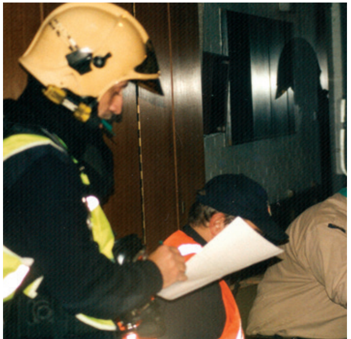
Als de hulpdiensten er zijn, zit je taak erop. Zij nemen alles over.

Anne: De pers kan je niet negeren. Daarom werd in de nieuwe wetgeving de discipline informatie toegevoegd en werden rampterrainen ingedeeld in rode, oranje en gele zones. In principe blijft de pers buiten de oranje zone, tenzij er een afwijking werd verleend door de directie informatie.