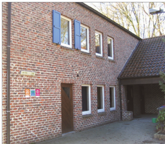
CJT Ondersteuning moet uitbaters meer raadplegen, alvorens standpunten in te nemen.

De feedback van de uitbaters bij vorige vraag is vooral positief. De meeste uitbaters vinden het handig dat een organisatie dit goed opvolgt, ook al heeft niet iedereen zicht op wat er precies gebeurt. Over de communicatie zijn de meningen echter verdeeld. Sommigen hebben het gevoel met alles mee te zijn dankzij bijv. HuisWerk of vormingsmomenten. Voor anderen is het allemaal veel te beperkt.