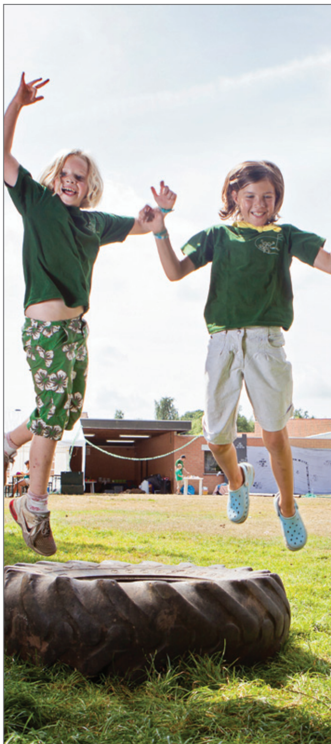
Terugkoppeling na het vertegenwoordigingswerk is wenselijk voor een grote meerderheid van de uitbaters.