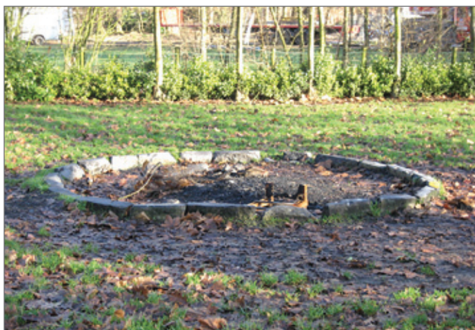
Qua regelgeving kampvuren is Wallonië het voorbeeld.

De voorbije jaren vergaderde CJT enkele malen met kabinetsmedewerkers van de minister van onderwijs. We wilden hen wijzen op de gevolgen van de maximumfactuur voor het jeugdtoerisme. Onze belangrijkste eis was dat de maximumbedragen minstens zouden geïndexeerd worden en dat is uiteindelijk het geval sinds dit schooljaar.