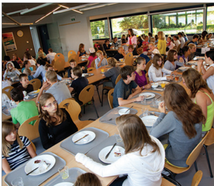
Heel wat uitbaters klagen over te veel en te strenge regelgeving.