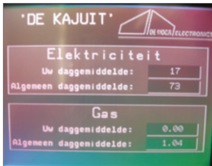
Een display toont het gemiddelde verbruik van andere groepen en het eigen verbruik.

Hebben verlichtingsspecialisten voldoende ervaring met jeugdverblijven? Het opstellen van een lichtstudie is een duobaan: de verlichtingsspecialist heeft de technische kennis en de uitbater de praktijkervaring. Dit werkt perfect.