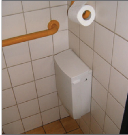
Tracht de vloer in de toiletten zo vrij mogelijk te houden.