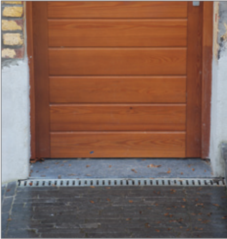
Een afvoerrooster aan een buitendeur is bijzonder praktisch.