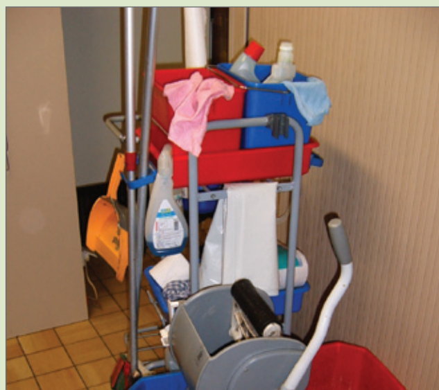
Alle benodigheden meteen bij de hand.