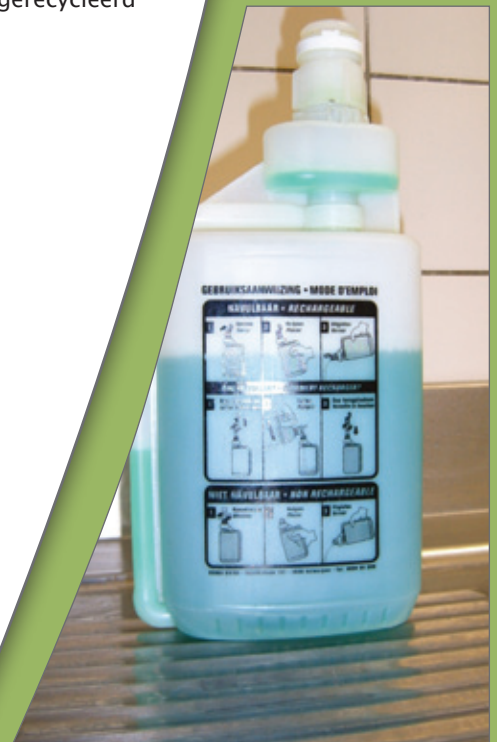
Navulbare verpakkingen zijn beter voor het milieu.

Sorteren van afval gebeurt best bij de bron. Vuilbakken per restfractie voorzien in de lokalen stimuleert dit. In die vuilbakken kunnen vervolgens op maat gemaakte vuilzakken zitten waardoor het ophalen van het vuil vlotter kan verlopen en de vuilbakken zelf aan geen schoonmaak moeten worden onderworpen. Vanuit ecologisch standpunt bestaan die afvalzakken best uit gerecycleerd materiaal.