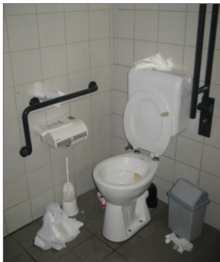
Veel kinderen en jongeren moeten nog leren poetsen.

Het klopt dat schoonmaken bij zo'n groepen zinloos lijkt en ontmoedigend werkt, maar als uitbater heb je geen keuze. Niet poetsen is geen optie.