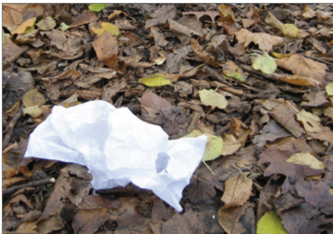
Ook het buitenterrein moet opgeruimd worden na het verblijf.