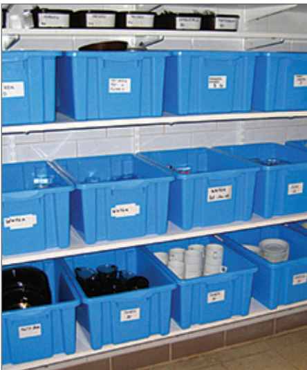
Handige opbergsystemen vergemakkelijken de eindcontrole.

Is de schoonmaak ondanks alle inspanningen niet tijdig afgerond, dan kan je in uitzonderlijke gevallen enkele daglokalen aan de nieuwe groep toewijzen en de schoonmaak van bijvoorbeeld de slaapkamers en sanitair verder afronden. In de daglokalen kan de groep de bagage voorlopig stockeren en eventueel starten met de eerste activiteit. Een andere oplossing voor een te krappe tijds marge bestaat erin de vertrekkende groep te vragen om bepaalde lokalen (zoals de slaapzaal en een gedeelte van het sanitair blok) vroegtijdig te verlaten. Zo de controle en het eventuele (na) poetsen van die lokalen al voor het effectieve vertrek kan beginnen.