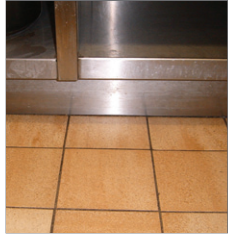
Afwerken tot aan de grond vermijdt vuil onder de keukenmeubels.