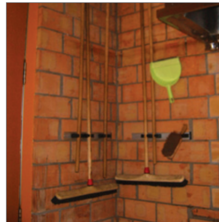
Ophangen van het poetsmateriaal verhoogt de levensduur.

In sommige gemeentes kan je wel terecht bij een plaatselijk werkgelegenheidsagentschap dat uitkeringsgerechtigde werklozen tewerkstelt bij particulieren, lokale overheden en niet commerciële verenigingen zoals vzw's.