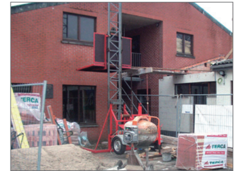
Bij infrastructuursubsidies wordt de bouwvergunning voorgelegd aan Toerisme Vlaanderen.

't Bakkershof: Een inspecteur van Toerisme Vlaanderen had me zelf aangeraden om een erkenning aan te vragen onder het decreet 'toerisme voor allen', omdat ik onder het hoevertoerisme niet meer echt thuis hoorde. Bovendien heb ik niet zoveel moeten wijzigen aan de infrastructuur.