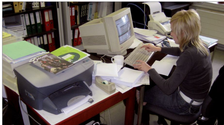
Facturen kunnen ingevoerd worden via een digitaal boekhoudpakket.

't Galjoen: Alle geldtransacties voeren we zelf uit en noteren we chronologisch in ons kasboek. Dit wil zeggen dat we onze facturen zelf opstellen en de betalingen ervan opvolgen. Ook de ontvangen facturen betalen we zelf. Het boekhouden zelf wordt door een boekhoudkantoor