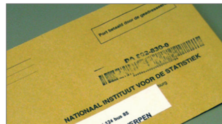
Cijfers doorgeven kan via www.jeugdverblijven.be

Meer info over subsidies Afdeling Jeugd: www.cjt.be/ondersteuning/basissubsidie www.cjt.be/ondersteuning/werkingsubsidie www.cjt.be/ondersteuning/personeelssubsidie