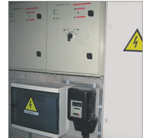
Elektriciteit wordt vijfjaarlijks gekeurd.

Meer info over labels: www.cjt.be/ondersteuning/anderelabels