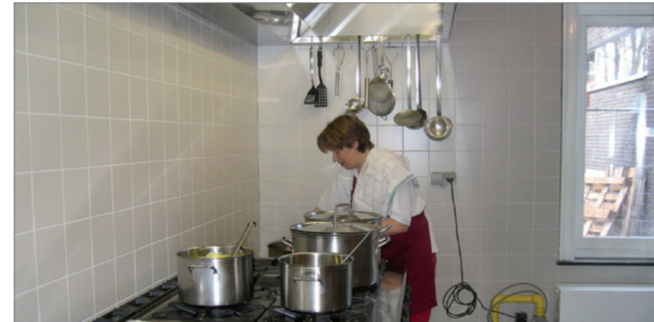
Medewerkers kruisen aan wat werd gecontroleerd.

‘t Galjoen: De wetgeving op de voedselveiligheid eist o.m. dat dagelijks de temperatuur van de koelkast en diepvries wordt opgemeten en genoteerd. Hetzelfde geldt wanneer vlees wordt geleverd.