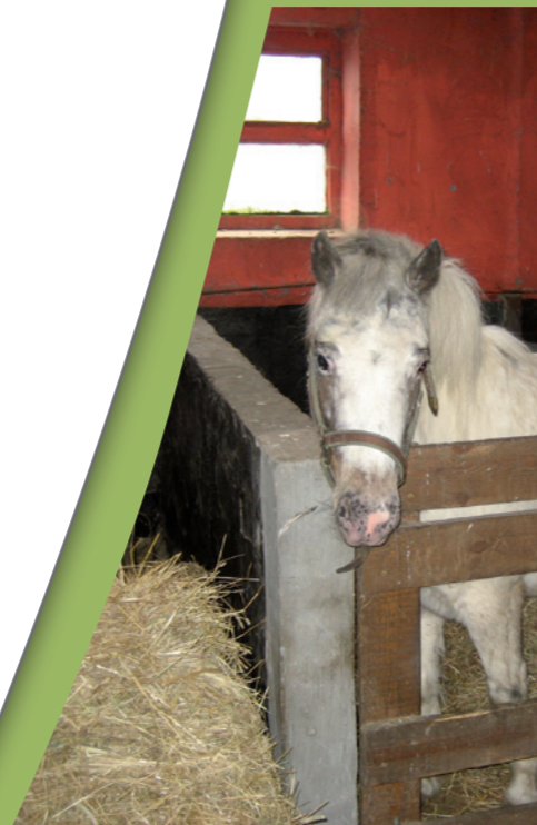
Bepaalde dieren moeten geregistreerd worden.