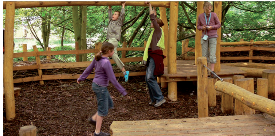
Ook speeltoestellen zijn onderworpen aan controles.

‘t Bakkershof: Ik stel geen uurrooster op. Mijn medewerker is tewerkgesteld via begeleid werken en heeft vaste uren. In de praktijk helpt hij me in de keuken en bij de verzorging van de dieren. We doen alles samen.