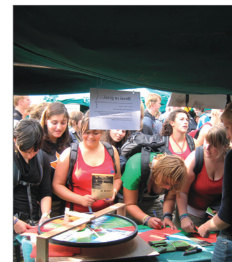
Promotie kan ook op startdagen van jeugdbewegingen.

eens over het hoofd gezien, maar minstens om de twee maanden wordt die toch bijgewerkt. Die kalender is dus niet altijd zo actueel als mijn agenda. 't Galjoen: Een publieke kalender hebben we niet. Dit is in ons geval te complex. Het is een gebouw met meerdere entiteiten. Onze boekingskalender is een intern exceldocument.