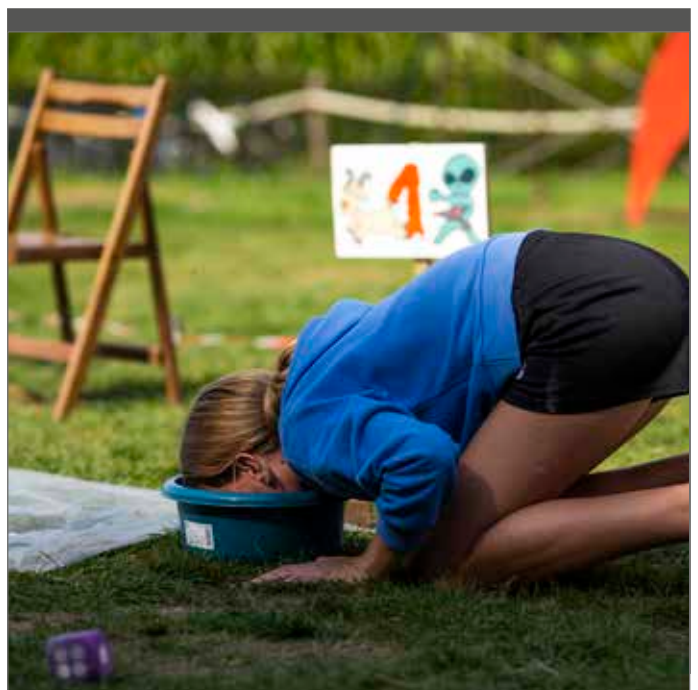
Op het principe van uitbetalen van schadevergoeding is één uitzondering, nl. overmacht.

Er kan discussie zijn over de directe oorzaak die ervoor zorgt dat een verblijf niet kan doorgaan. Opnieuw toonde corona aan dat dit niet altijd even duidelijk is. Zo is er een groot verschil tussen het annuleren van een verblijf onder bevel van de overheid en het preventief annuleren van een verblijf uit angst voor besmettingen.