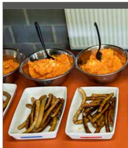
De overgrote meerderheid van de groepen zal begrip tonen en bijdragen in (een deel van) de gemaakte kosten.

Wees vooral voorzichtig met zomaar omboeken ver in de tijd. Want doordat dezelfde overeenkomst blijft gelden, kan de prijs niet zomaar worden verhoogd. Bij reeds gesloten overeenkomsten, waarin geen wijzigingsbeding is opgenomen, is het eenzijdig wijzigen van de prijs immers niet mogelijk. De gesloten overeenkomst is immers bindend voor de partijen en in geval van gewijzigde omstandigheden (bijv. prijsstijging van grondstoffen, personeelskosten ...) moet de overeenkomst in principe worden uitgevoerd zoals initieel overeengekomen.