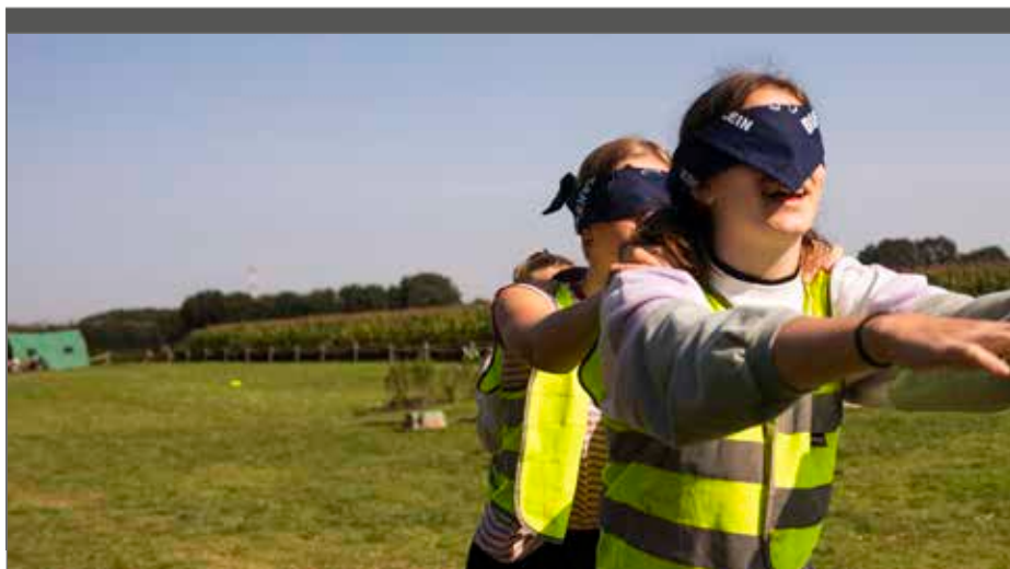
Bij het bepalen van de spelregels rond overmacht dien je ook rekening te houden met het Wetboek economisch recht.

om een niet-limitatieve opsomming gaat. Zo vermijd je om bepaalde overmachtsituaties uit het oog te verliezen.