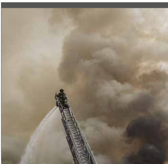
Lotte De Brabandere (Den Otter): "We kregen veel steunbetuigingen na onze brand en sommige groepen stortten zelfs een deel van hun waarborg op de rekening van onze crowdfunding."

Stad Gent gaf ons containers, zodat we konden overwinteren met onze scoutswerking, maar voor verhuur voldeden die containers